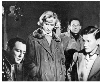
1957 AGENT SECRET S.Z. (Carve her with pride) de L. Gilbert avec M. Ronet, V. McKenna