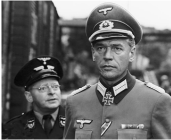
1964 LE TRAIN (The Train) de John Frankenheimer avec Victor Beaumont