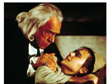
1996 LA CHASSE AUX SORCIÈRES (The Crucible) de Nicholas Hytner avec Winona Ryder