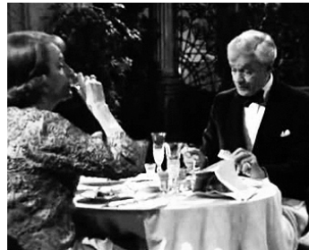
1982 A SONG AT TWILIGHT de Cedric Messina avec Deborah Kerr