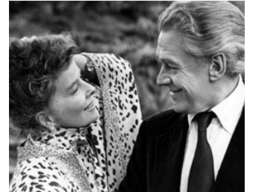
1973 A DELICATE BALANCE de Tony Richardson avec Katharine Hepburn