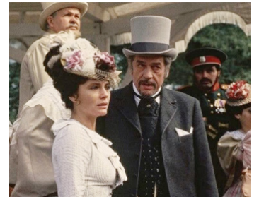
1985 ANNA KARÉLINE (Anna Karenina) de Simon Langton avec Jacqueline Bisset