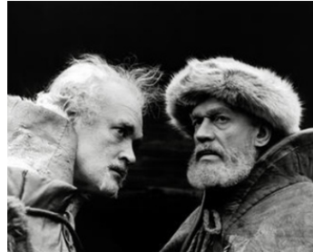
1970 LE ROI LEAR (King Lear) de Peter Brook avec Patrick Magee