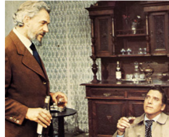
1972 SCORPIO (Scorpio) de Michael Winner avec Burt Lancaster