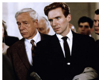
1994 QUIZ SHOW (Quiz Show) de Robert Redford avec Ralph Fiennes