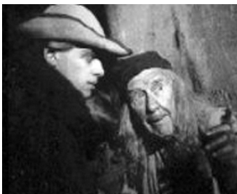
1987 MISTER CORBETT'S GHOST de Danny Huston avec Danny Huston