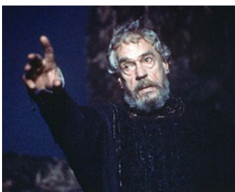
1989 HAMLET (Hamlet) de Franco Zeffirelli