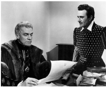
1954 LA PRINCESSE D'EBOLI (That Lady) de Terence Young avec Gilbert Roland