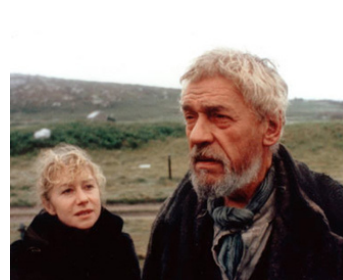
1988 L'ÎLE AUX BALEINES (When the Whales came) de Clive Rees avec Helen Mirren