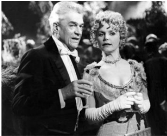
1977 LES AMBASSADEURS (The Ambassadors) de James Cellan Jones avec Lee Remick