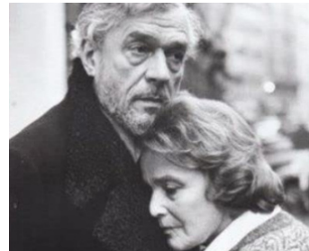
1984 MILLE NEUF CENT DIX-NEUF (Nineteen nineteen) de Hugh Brody avec Maria Schell